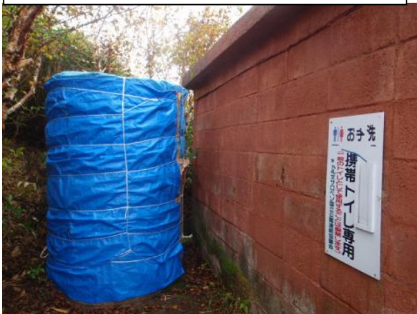
沓形コース避難小屋横の閉鎖されたトイレブース