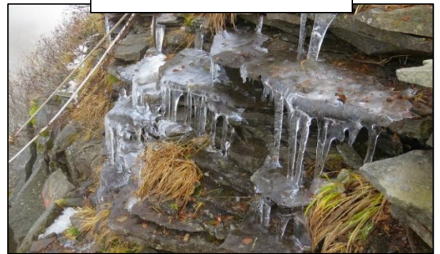
沓形コース背負子投げ（凍結）