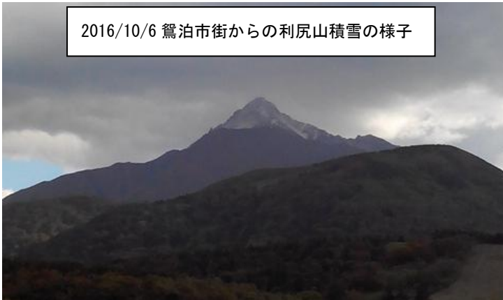
2016/10/6 鴛泊市街からの利尻山積雪の様子